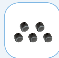
Wielen voor zachte ondergrond diameter 6 cm