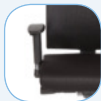
Verstelbare 3D armsteunen