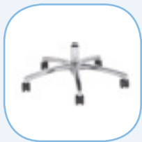
Staal aluminium gepolijst voetkruis

“Bekijk onze complete NEN & NPR gecertificeerde stoelen hier: www.schaffenburg.nl .”